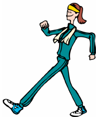
怎樣的步行運動才有益

要讓步行達到運動的效果，你行走的速度要快到可使你心跳得快而有力，使你呼吸快而深。當你加速步伐，會令心臟肌肉強健，因而更有力推動血液循環，攜帶更多氧氣供給全身。